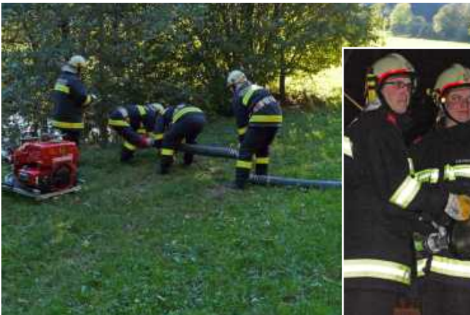
Aufbau einer Saugleitung