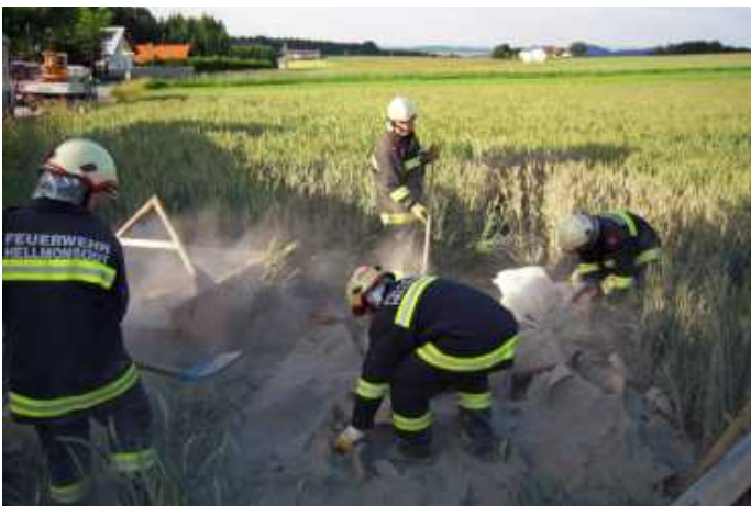
Aufräumen nach einem VU in der Hochheide.