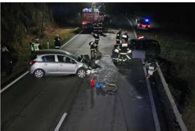
Aufräumarbeiten nach Verkehrsunfällen auf der B126