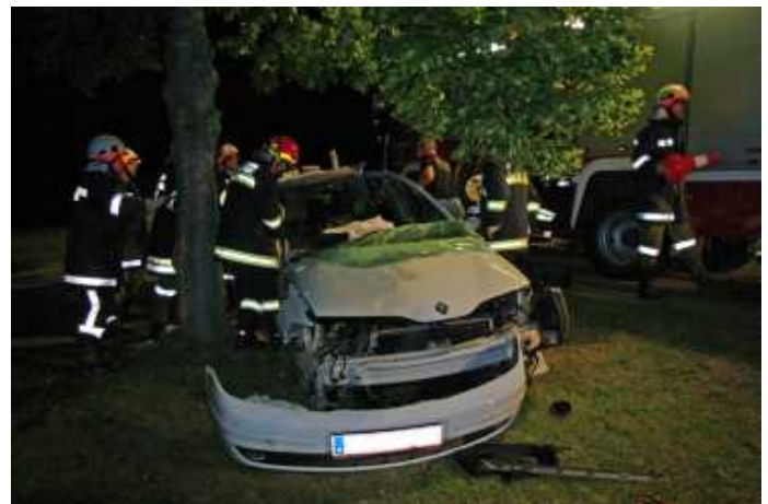
Eingeklemmte Person in Albrechtschlag.