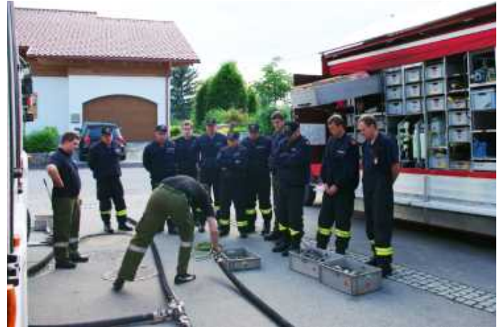
Übung mit dem Gefährliche-Stoffe-Fahrzeug