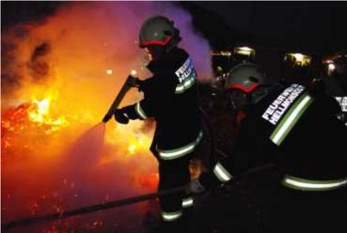
Brand einer Holztriste

Einsatzbereitschaft 24 Stunden – 365 Tage – freiwillig!