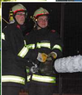
Übung Branddienst mit Löschschaum