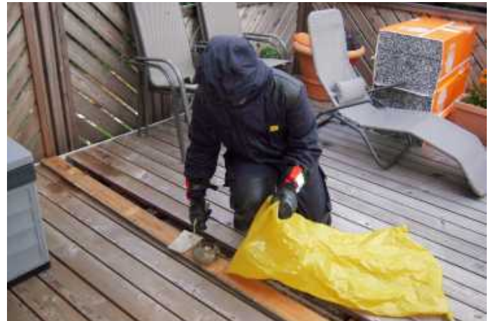
Diverse Wespennester mussten entfernt werden.