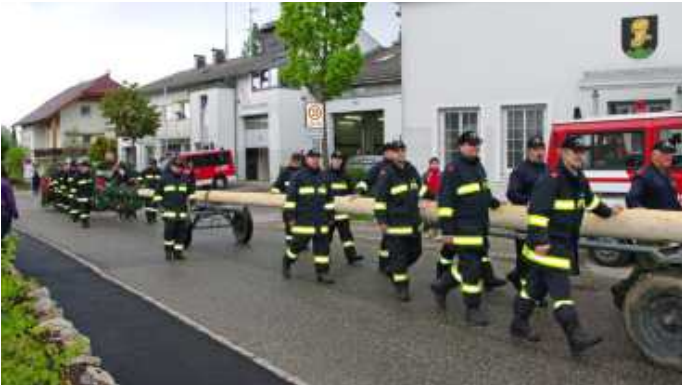
Der Maibaum wurde aufgestellt.

Nicht nur Einsätze und Übungen prägen das Feuerwehrwesen, auch bei diversen Veranstaltungen ist die Feuerwehr nicht wegzudenken.