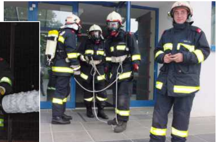
Atemschutz – jede Übung eine Herausforderung