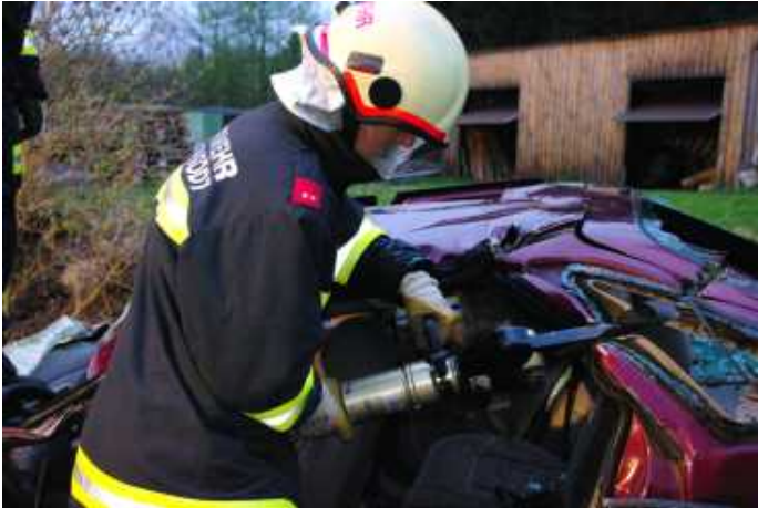
Technische Ausbildung – ein Schwerpunkt in unserer Feuerwehr.

schinisten-Ausbildung, Atemschutz, Lotsen- und Nachrichtendienst und feuerwehrmedizinischer Dienst abgehalten. Insgesamt wurden über 600 Stunden in die Ausbildung der KameradInnen investiert, um im Ernstfall auf alle möglichen Lagen vorbereitet zu sein.