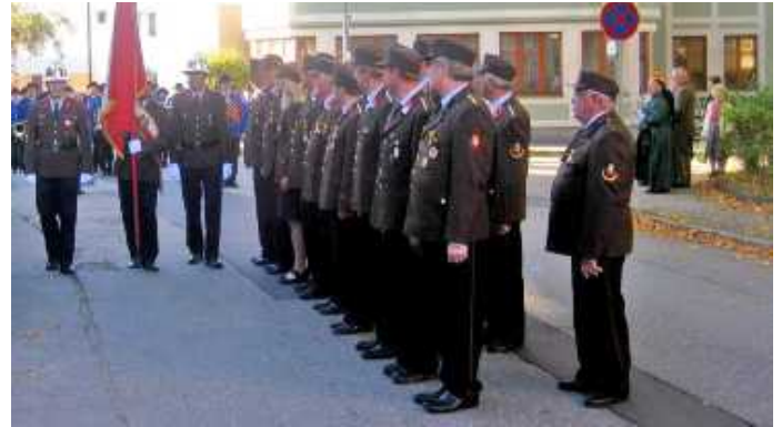
Ausrückung bei diversen Festlichkeiten.